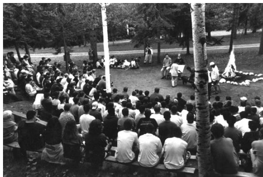
Aftenunderholdning i Camp Nebagamon, Wisconsin

Camp counselor kan sammenlignes med at være leder i en dansk spejderlejr eller feriekoloni. Som counselor vil du (ofte sammen med en anden counselor) få ansvaret for en gruppe børn. Dvs. at du sørger for, at de kommer op om morgenen, møder til måltiderne, deltager i deres valgte aktiviteter osv. Desuden vil du i løbet af dagen fungere som leder eller medhjælper ved forskellige aktiviteter.