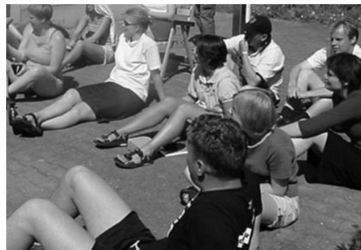
Billede fra DUTA's introduktionskursus i bededagsferien.

DUTA samarbejder med ICCP, der er en del af det amerikanske YMCA (KFUM). Det er ICCP, der formidler kontakten til lejrene i USA.